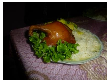
Cuy mit Reis, Kartoffeln und Salat