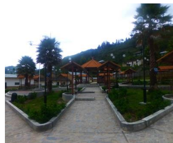
Plaza von Maino